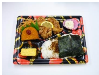
のり唐揚げ弁当 500円