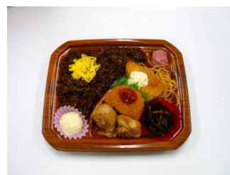
えびめしランチ 500円