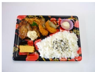
チキン南蛮& 海老フライ弁当 500円